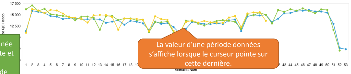
Production hebdomadaire de viande porcine au Québec (tonnes)

La valeur d'une période données s'affiche lorsque le curseur pointe sur cette dernière.