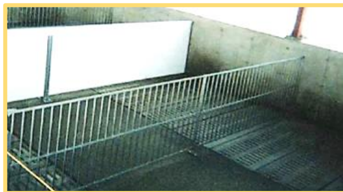
Plancher partiellement latté

Lors de la conception d'un nouveau bâtiment, le fait d'opter pour un plancher entièrement latté ou latté aux deux tiers permettra de réduire les émissions d'odeurs. En pratique, les émissions d'odeurs, associées à ces deux types de plancher, peuvent être équivalentes. En théorie, dans le cas d'un plancher entièrement latté, une plus grande surface de contact entre l'air et le lisier pourrait accroître les émissions d'odeurs par rapport à un plancher latté aux deux tiers. Il sera toutefois aisé, pour l'éleveur, d'adopter une stratégie d'évacuation des lisiers qui permettra de contrer cette augmentation des émissions d'odeurs.