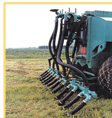
Rampe à prairie munie de pendillards Source : FPPQ. 2005. Fiche technique n° 5.

Sources : FPPQ. 2005. Fiche technique n° 5. FPPQ. 2005. Fiche technique n° 8.